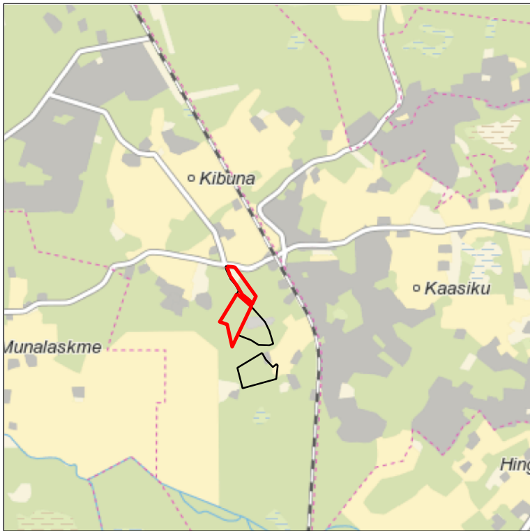
Kaardileht nr 6331 Keila